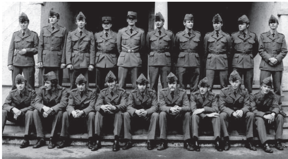
Die Fallschirmgrenadier-Rekruten des Jahrgangs 1971 mit ihren Kadern, Instruktoren und Fallschirmsprunglehrern. Damals...